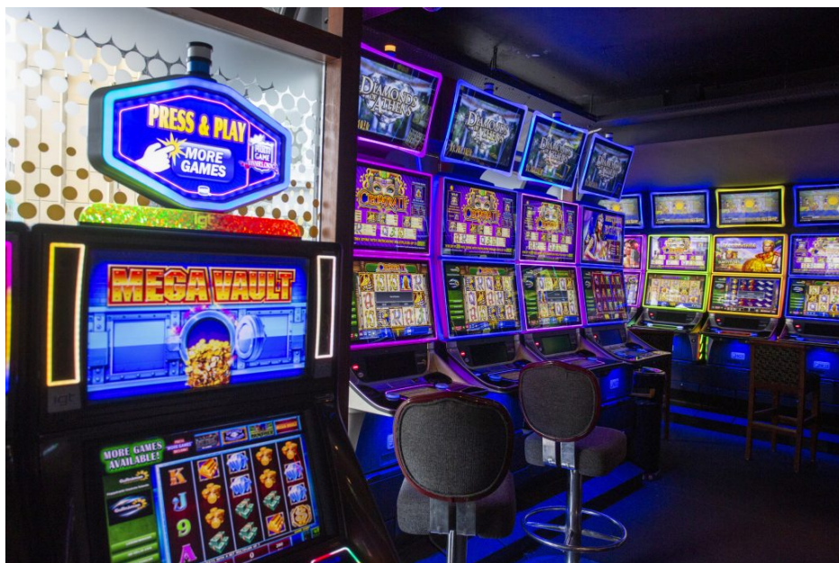
Maðurinn sagði við konuna sína að hann myndi fara ef hún færi að taka smálán til að fjármagna spilafíklina. Við það stóð hann.

Erla Hlynsdóttir Mánudaginn 22. júní 2020 21:30