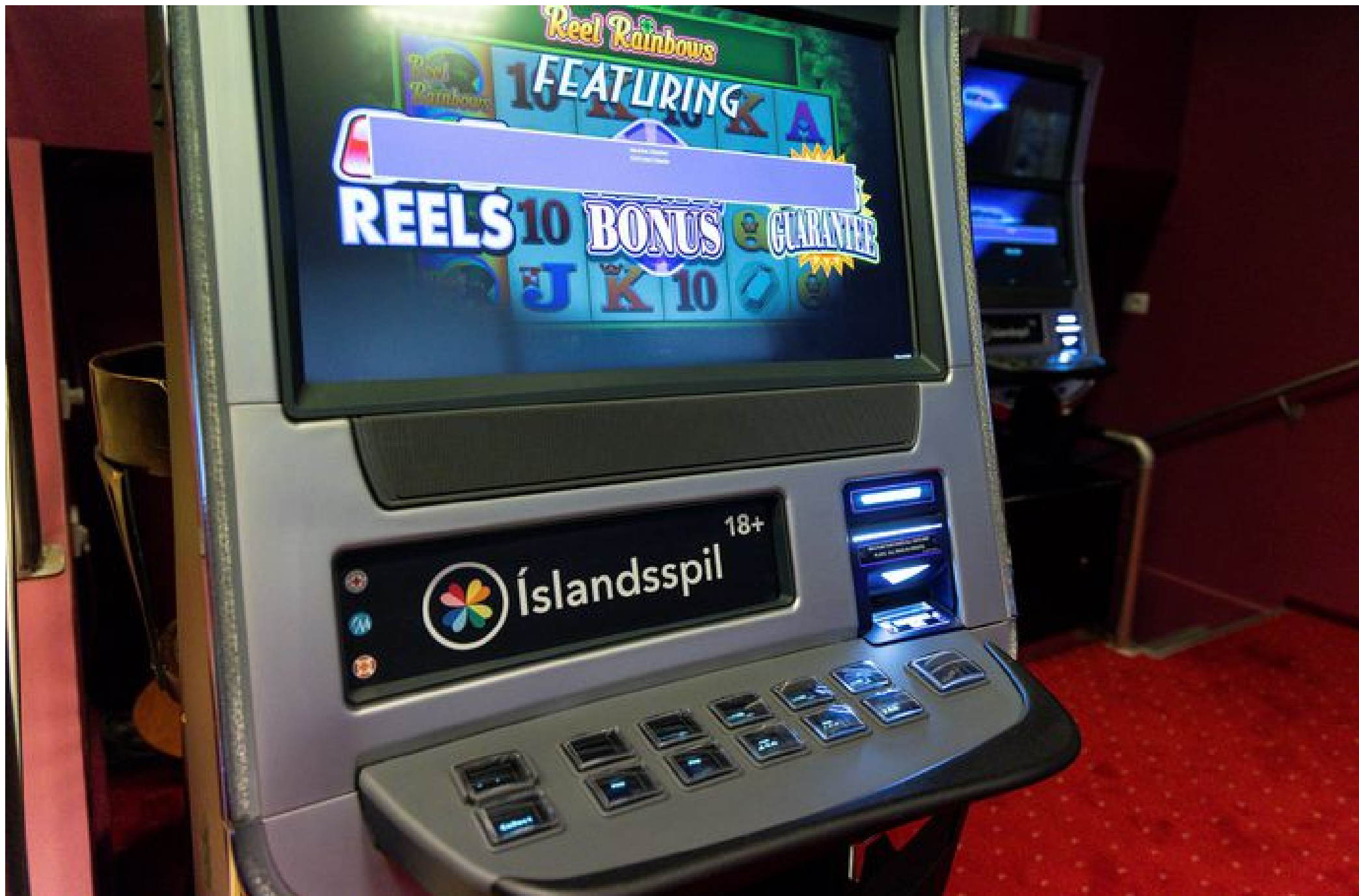
Íslandsspil og Hapdrætti Háskóla Íslands reka hundruð spilakassa. Viðmælendur Kompáss segja líf spilafíkla jafn mikils virði og þeirra sem njóta arðsemi kassanna, en gróðinn er